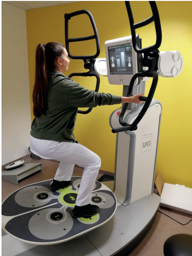
Travail d'équilibre sur plateforme Huber

Vous êtes motivé pour participer au programme de réentraînement à l'effort.