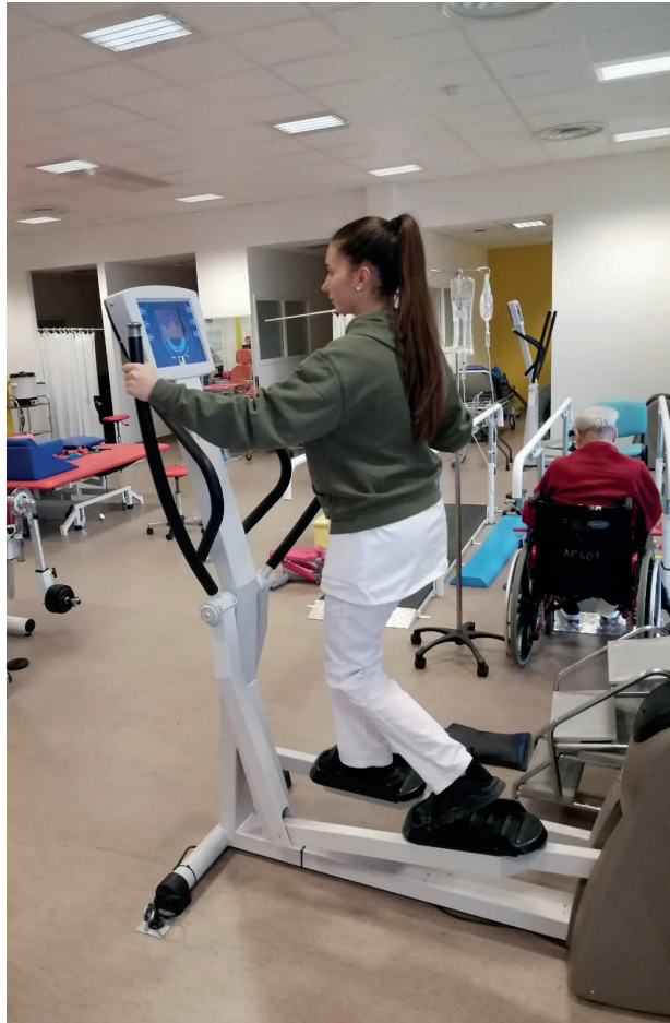
Travail d'endurance sur vélo elliptique